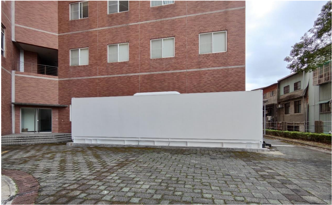
【照片說明】本校與台塑企業共同設置儲能櫃，40 呎電池櫃建置於創新大樓後方。