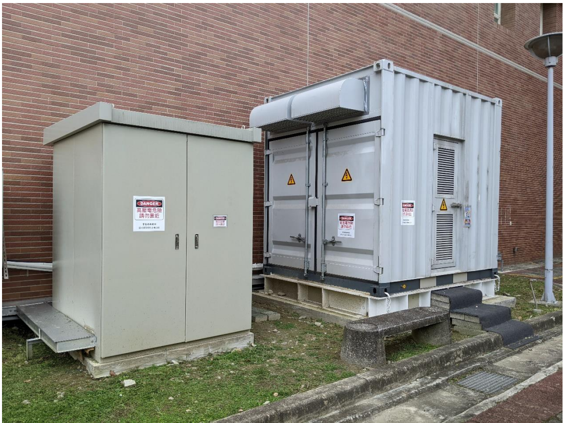
【照片說明】本校與台塑企業共同設置儲能櫃，10 呎設備櫃建置於創新大樓後方。