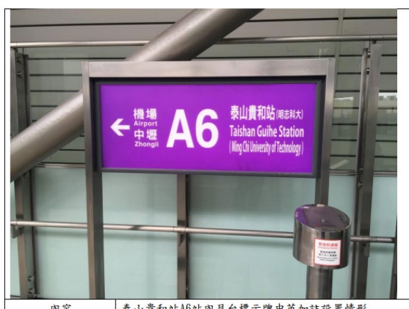
內容 泰山貴和站A6站內月台標示牌中英加註設置情形

https://csr.mcut.edu.tw/var/file/31/1031/img/2105/235658726.pdf