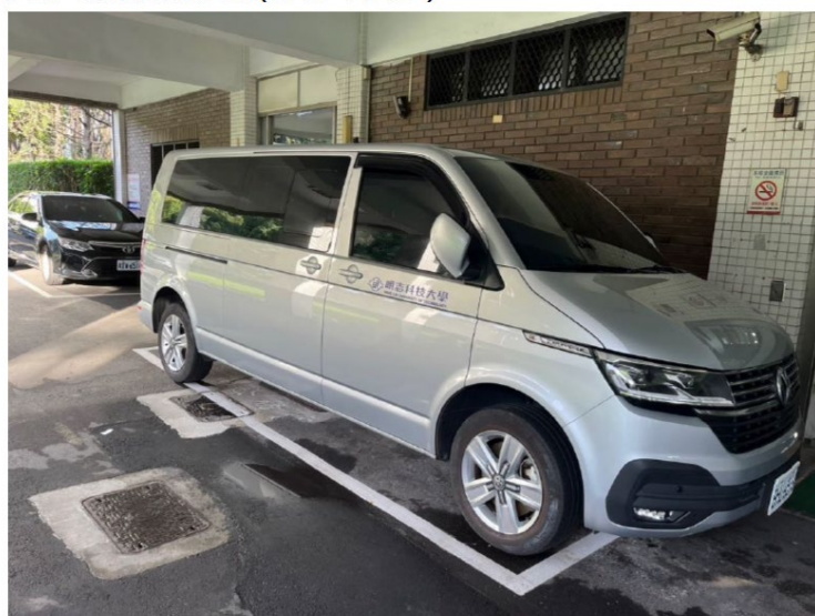
本校公務共乘公務車供洽公及出差使用