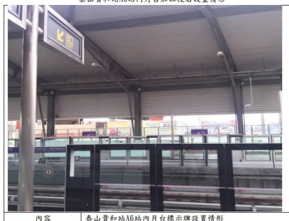
內容 泰山貴和站A6站內月台標示牌設置情形