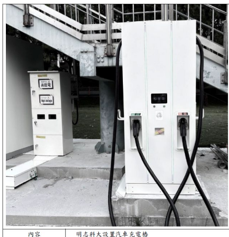
校園設置電動車充電樁