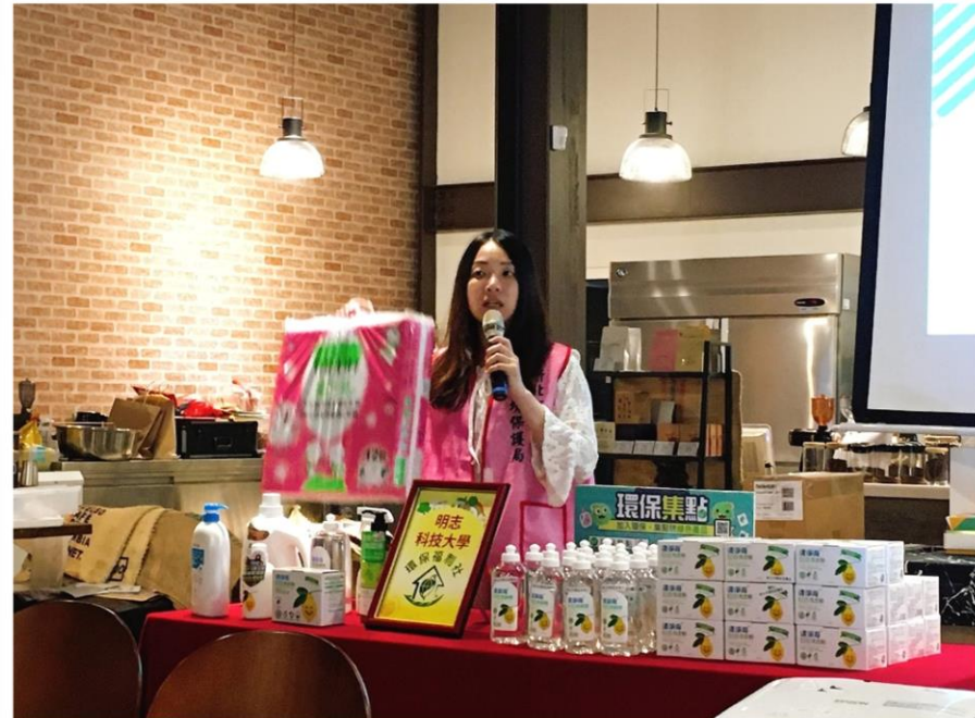
新北市環保局蒞校進行綠色消費宣導活動